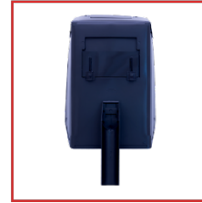
MASCARILLA DE PROTECCION