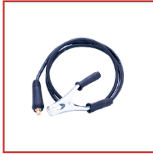
PINZA DE MASA