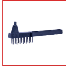
CEPILLO DE SOLDADURA