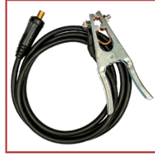
ALICATE DE MASSA